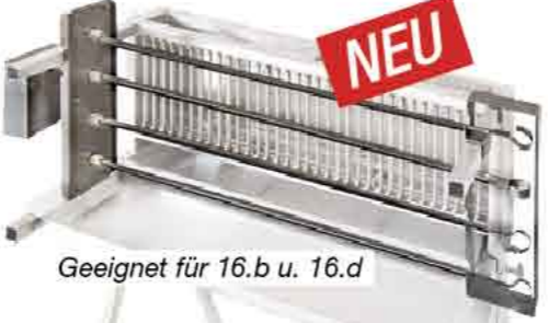
Geeignet für 16.b u. 16.d