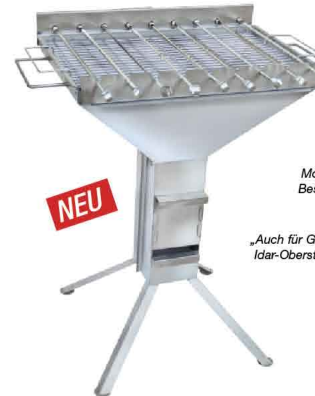
Motor siehe Best.Nr. 41.a

mit 9 motorangetriebenen drehbaren Spießen, nutzbare Spießlänge 38 cm, Höhe 89 cm, Breite 78 cm, Tiefe 58 cm, inkl. Grillrost