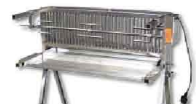
Motor siehe Best.Nr. 41.a