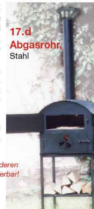
17.d Abgasrohr, Stahl