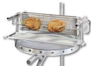
Motor siehe Best.Nr. 41.a