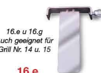
16.e u. 16.g Auch geeignet für Grill Nr. 14 u. 15

16.e Trennblech , teilt die Feuerung auf die Länge des Grillgutes, dies spart sehr viel Holzkohle.