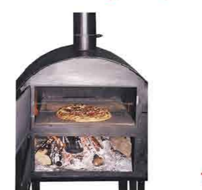
Auch in anderen Größen lieferbar!