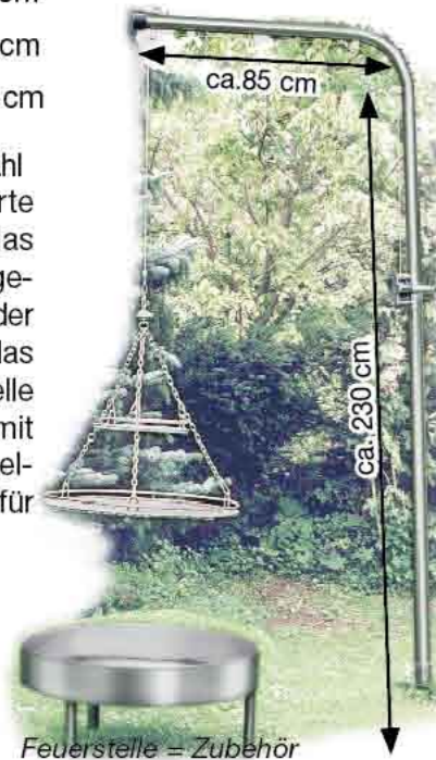
Feuerstelle = Zubehör