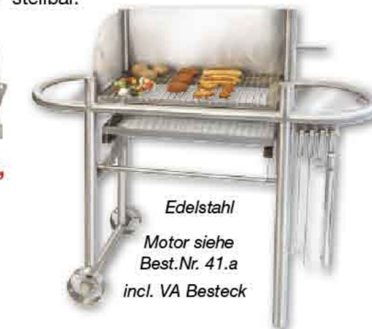
Edelstahl Motor siehe Best.Nr. 41.a incl. VA Besteck