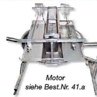
Motor siehe Best.Nr. 41.a