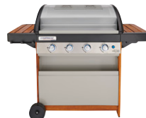
4 Series DH Woody LX Zwei-Zonen Grill UVP: 699,00 €