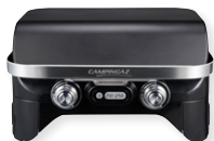
Attitude 2100 EX UVP: 399,00 €