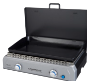
Plancha BF LX + UVP: 299,00 €