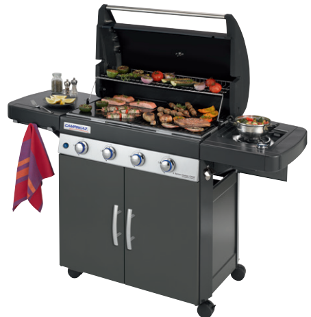
4 Series Classic EXSE

3 Jahre Garantie auf die 4 Edelstahl Rohrbrenner