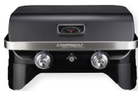
Attitude 2100 LX UVP: 329,00 €