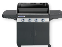
4 Series DH Classic EXS Zwei-Zonen Grill UVP: 849,00 €