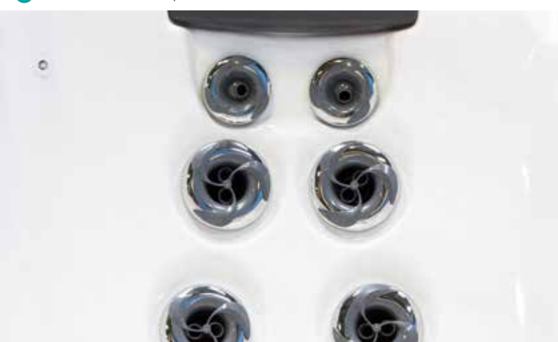
2 Jets in Stainless Steel | Stainless-steel jets