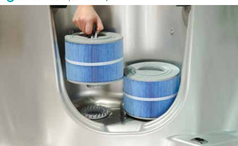
3 Gründliche Wasserreinigung mit Filter und Ozonator | Filter and ozonator for thorough cleaning of the water