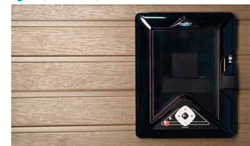
5 Premier Bluetooth Entertainment System | Premier Bluetooth entertainment system