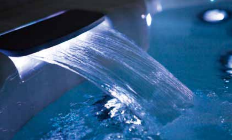
1 Beleuchteter Wasserfall | Illuminated waterfall