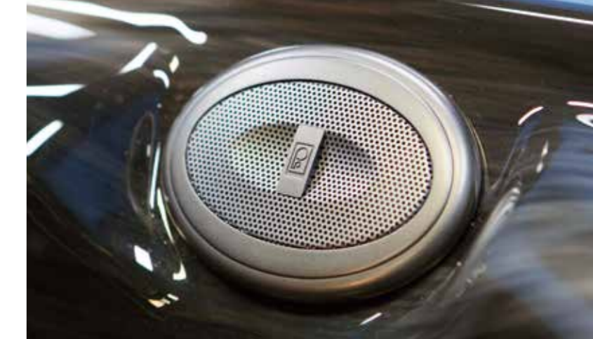
4 Leistungsstarke Stereo-Boxen | Powerful stereo speakers

An audio system with Bluetooth connection is available as an optional extra for maximum musical enjoyment with the X-Series. The smartphone to feed in the desired music tracks is stored in a special waterproof box. And the loudspeakers? An integral part of the hot-tub design, they ensure hours of atmospheric relaxation. As a finishing touch, add illuminated jets to flood everything with an enchanting light.