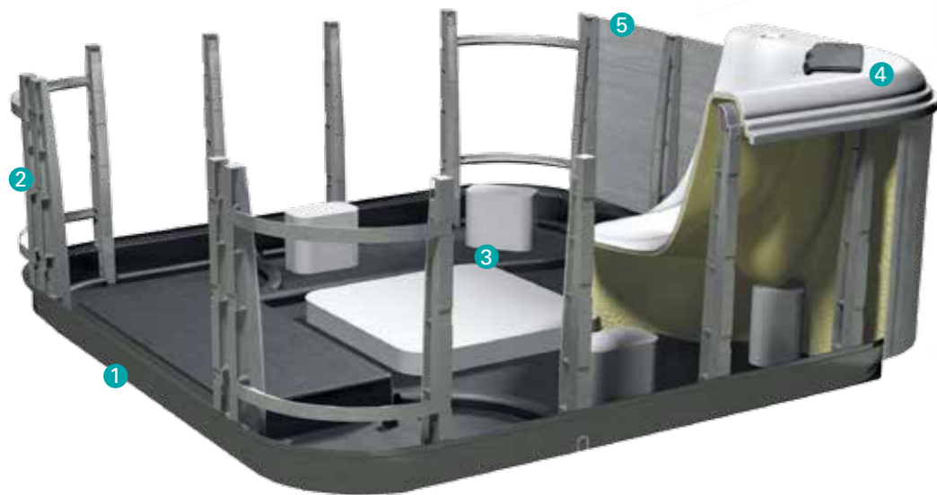
Äußerst stabil und langlebig: die Endura Frame™ Unterkonstruktion aus Kunststoff Extremely stable and durable: the Endura Frame™ support structure made of synthetic material